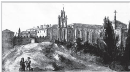
Grabado de la época del Monasterio de la Encarnación.

Enfermó otra vez, y ella misma describe con realismo aquella enfermedad tan grave. Su