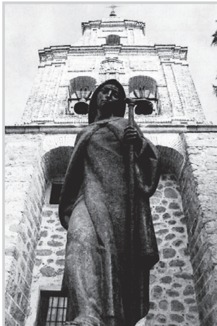
Santa Teresa ante la fachada de la Encarnación.

padre la tuvo en casa, la cuidó con mimo, la llevó incluso a una curandera rural, la de Becedas, de acuerdo con los usos y con la medicina del tiempo. No se explica uno cómo pudo sobrevivir a aquellos tratamientos, «porque casi un mes me había dado una purga cada día» ( Vida , 5-7). Retornó a Ávila, la tuvieron por muerta, y en estado lamentable volvió a su convento. Atribuirá la curación a los médicos celestiales, en los que confiaban aquellas sociedades más que en los terrenos. Concretamente, a uno, a San José.