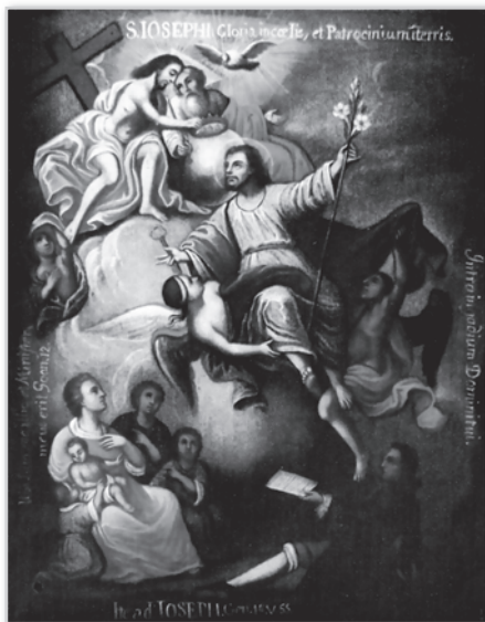
«Ascensión de San José». Anónimo, siglo XIX.

La Trinidad terrenal consta de la Virgen, San José y el Niño Jesús. Sabemos que Jesús ascendió a los cielos por su propio poder, que la Virgen lo hizo con la ayuda de los Ángeles, pero que San José no ascendió ni tuvo ascensión. ¿Es esto cierto? Este artículo se decide a meditar este asunto, desde luego nada vanal. Podemos pensar que esta Trinidad terrenal pudo continuar en el Cielo en cuerpo y alma, pues no olvidemos que San José es el padre humano de Jesús y que es único y excepcional.