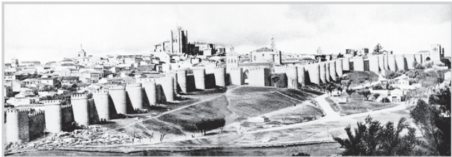
Vista desde la Encarnación de la provincia de Ávila.

que me sanasen. Y tomé por abogado y señor al glorioso San José, y encomendéme mucho a él. Vi claro que así de esta necesidad, como de otras mayores de honra y pérdida de alma, este padre y señor mío me sacó con más bien que yo le sabía pedir. No me acuerdo, hasta ahora, haberle suplicado cosa que la haya dejado de hacer. Es cosa que espanta las grandes mercedes que me ha hecho Dios por medio de este bienaventurado santo; que a otros santos parece les dio el Señor gracia para socorrer en una necesidad; a este glorioso santo tengo experiencia que socorre en todas, y que quiere el Señor darnos a entender que, así como le fue sujeto en la tierra, que como tenía nombre de padre, siendo ayo, lo podía mandar, así en el cielo hace cuanto le pide».