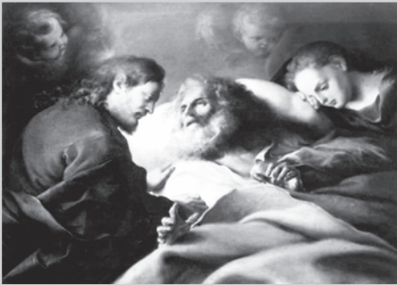
«Tránsito de San José», de Alonso Cano, siglo XVII.